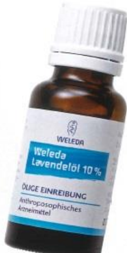
数滴取ったら、深呼吸。良質なラベンダーの香りを体いっぱいに取り込んでみて。ラベンダー ナイトオイル 20ml ¥2,800 / ヴェレダ・ジャパン

睡眠の質が悪い、旅先の時差で睡眠リズムが狂った、最近よく眠れない……など、眠りに関する不調を感じたときに使いたいのがこのオイル。集中、鎮静の効果があるといわれているラベンダーを10%という高濃度で配合して、寝る前に首筋や手首などに数滴つけるだけ。夜にはもちろん、心を集中させたい瞑想にも。