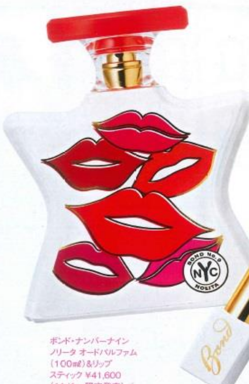
ボンド・ナンバーナイン ノリータ オードパルファム (100ml) & リップスティック ¥41,600 (11/1~限定発売) / ブルーベル・ジャパン

ボンド・ナンバーナインの新しい香りは、NYのダウンタウンで注目のエリア「ノリータ」。フリージアやみずみずしいタンジェリンなどが融合した華やかでフェミニンな香り。そんな女性らしさを表現するかのような「キスの嵐」がデザインされたボトルに合わせて、クリーミーなテクスチャーのリップがセットに。新鮮な香りと口もとのコラボレーションに挑戦してみてください。